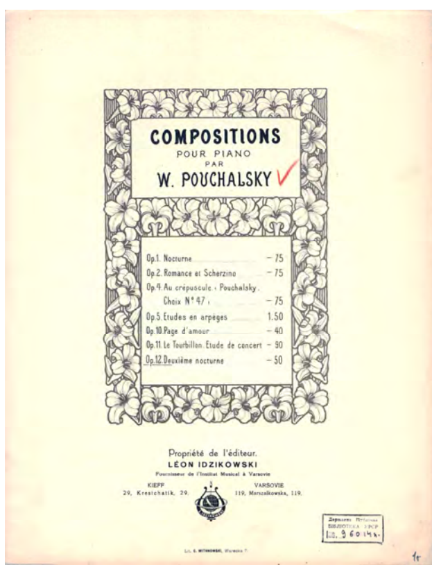
Титульні аркуші нотних видань творів В. Пухальського з фондів музичного відділу Національної бібліотеки України імені В. Вернадського.